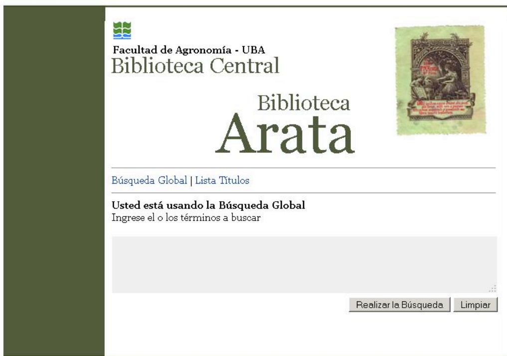
Ilustración 4: Interfaz de búsqueda global del Catálogo de la Biblioteca Arata