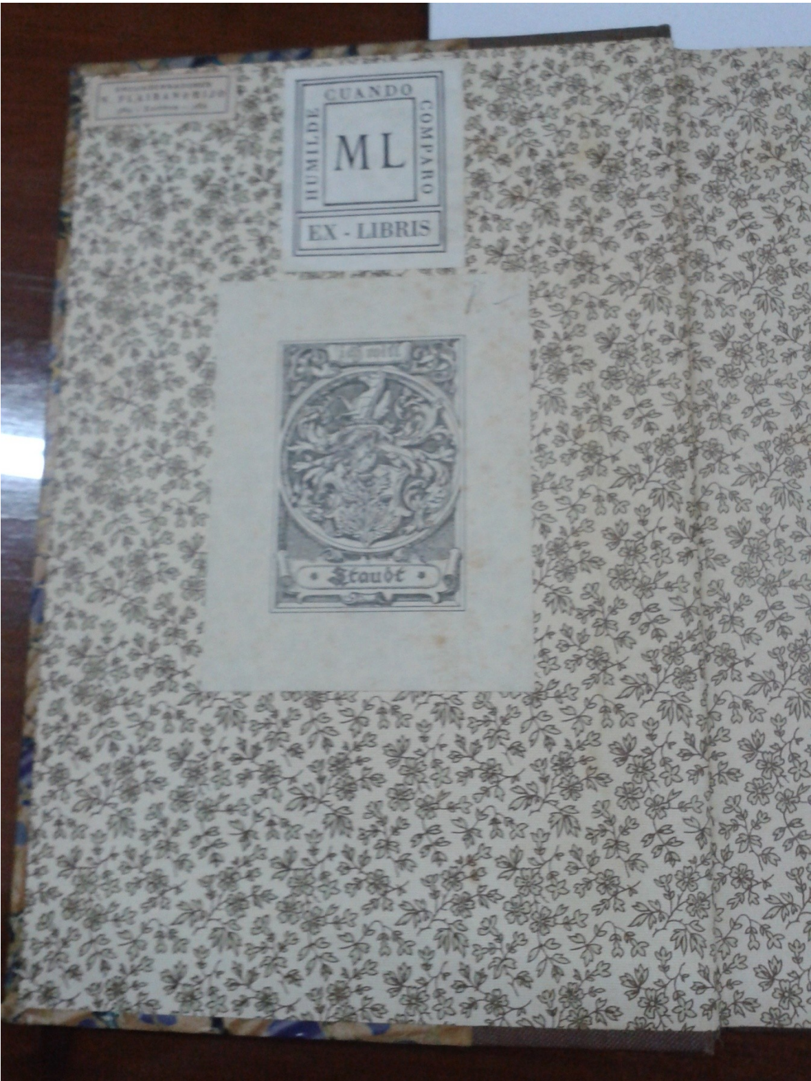
Ficha de Catalogación