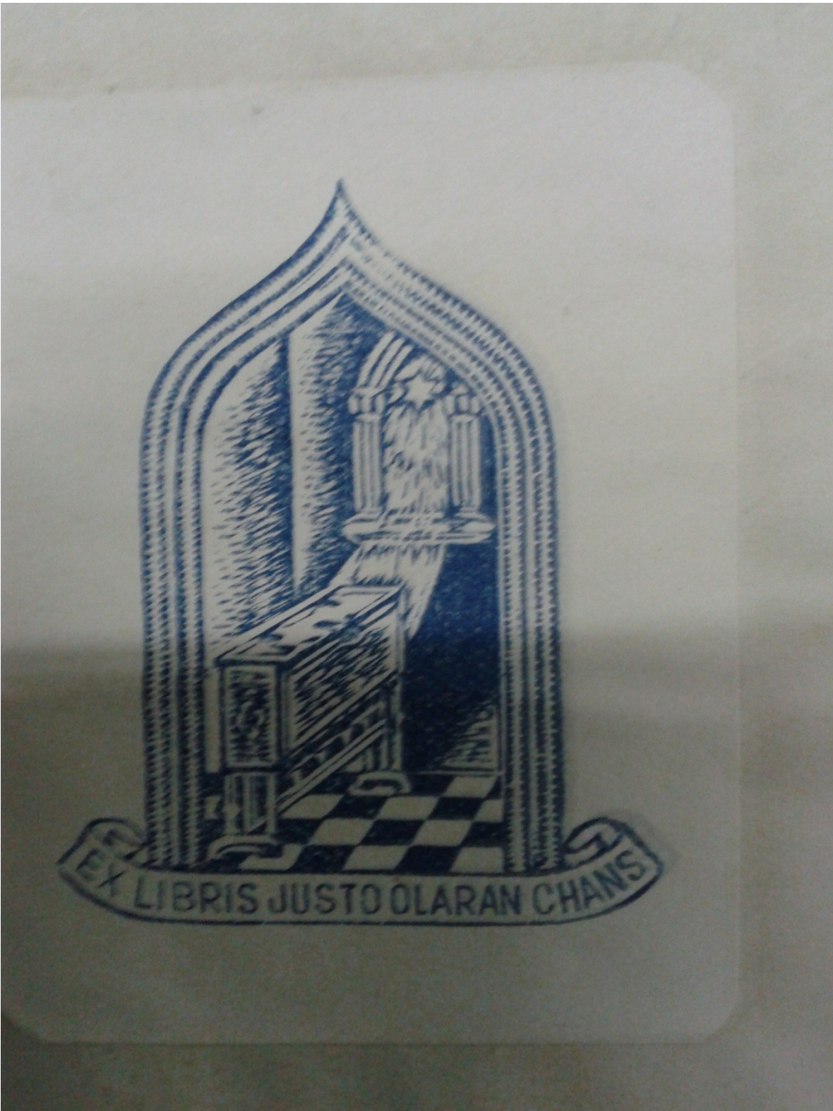
Ficha de Catalogación