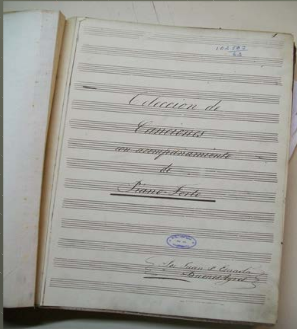
Facsimilar de partituras de José Pedro Esnaola (1808-1878)