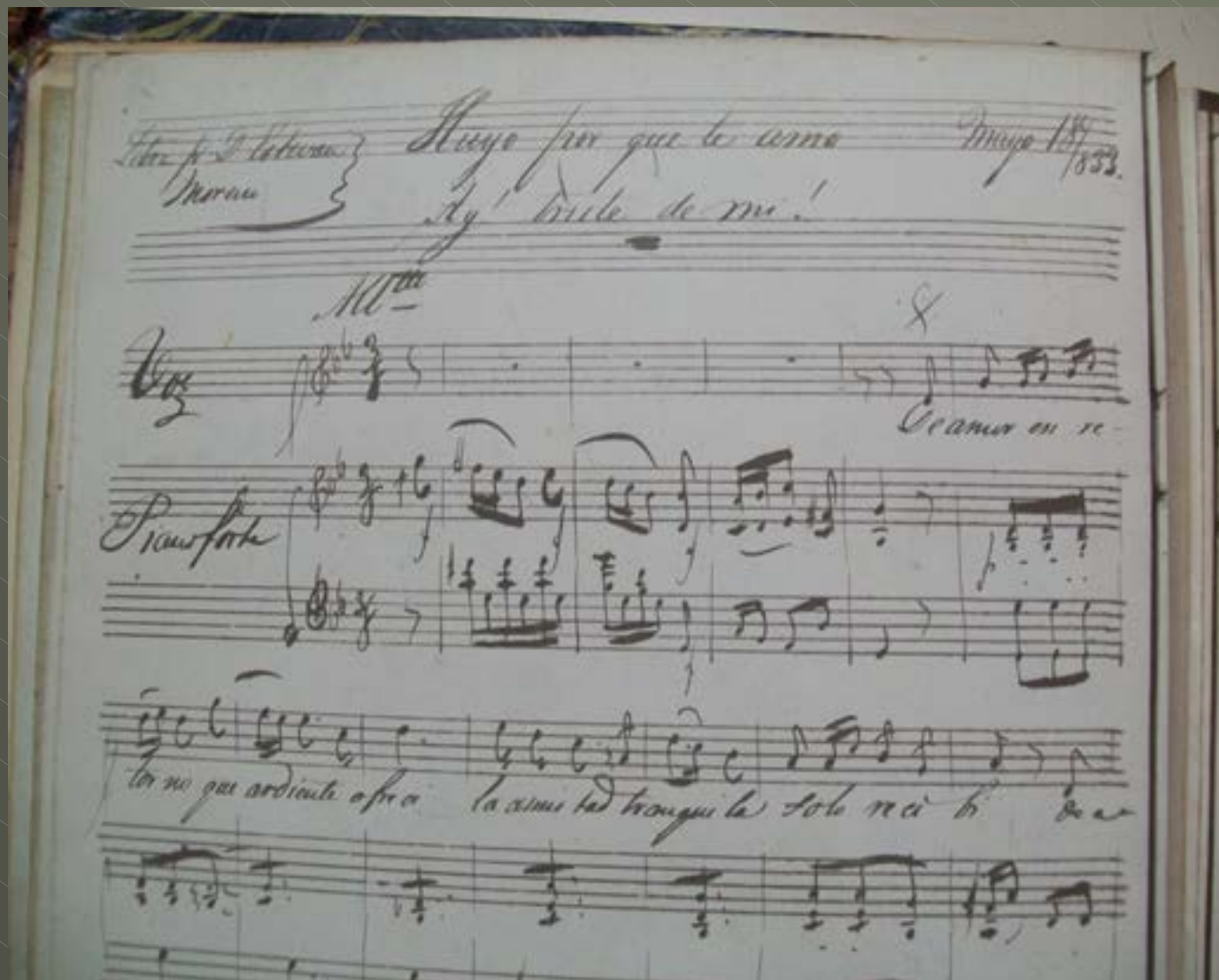
Detalle del facsimilar de partituras de José P. Esnaola (1808-1878)