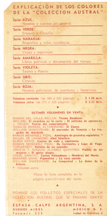
Fig. 3) Vista parcial de la solapa posterior de la sobrecubierta (ejemplar inv. 81342, BIBHUMA)