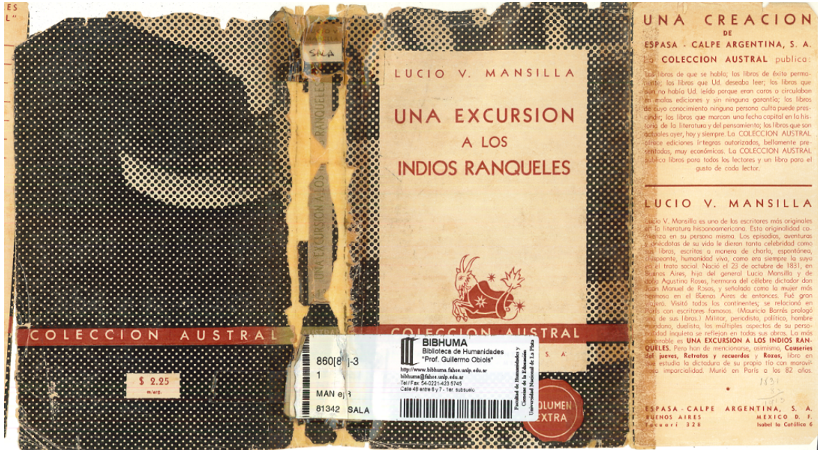
Fig. 1) Vista parcial de una sobrecubierta de la serie negra (viajes y reportajes) en la que se observa sólo la solapa frontal. Ejemplar perteneciente a la Biblioteca de Humanidades de la UNLP (en adelante BIBHUMA).

al pie (Fig. 1). En la solapa posterior se indican los colores que identifican las series comprendidas en la colección, el precio de comercialización de los ejemplares, los últimos volúmenes en venta y, al pie de la columna, el nombre y las direcciones de la editorial (Fig. 3).