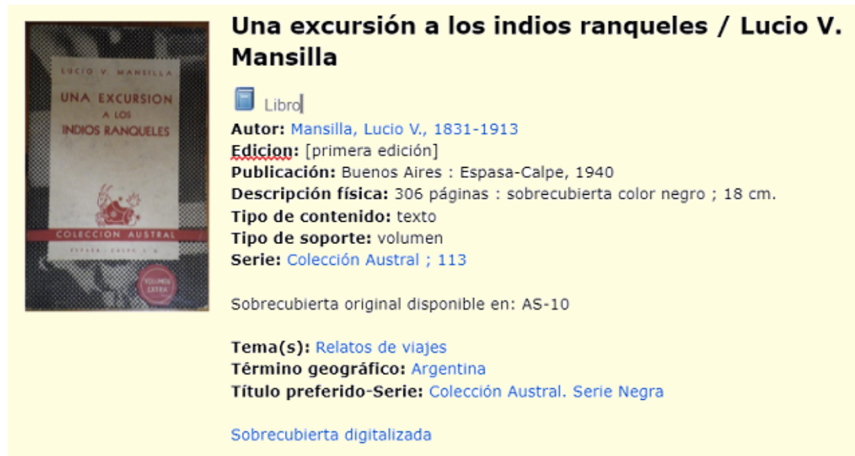
Fig. 4) Vista parcial estándar del registro ejemplificado en el OPAC.

Para ilustrar la aplicación de estas recomendaciones se ofrecen a continuación dos vistas correspondientes a un registro de un recurso de la misma manifestación que ejemplifica un ítem similar al que se muestra en las Figs. 1, 2 y 3 desarrollado según las instrucciones RDA en formato MARC21 conciso para datos bibliográficos.