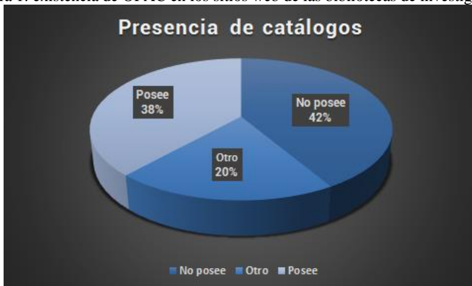
Figura 1: existencia de OPAC en los sitios web de las bibliotecas de investigación.

Entre estas 94 bibliotecas, la presencia de OPAC estuvo representada de la siguiente manera, tal como podemos observar en la figura 1: